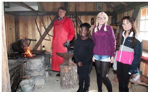
SMIA: Man kunne også besøke smia på Berg Bygdetun.