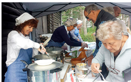
KORTREIST MAT: Bygdekvinnelaget hadde kokt store kjeler med god grøt. Kornet var malt på korn fra egne gårder.